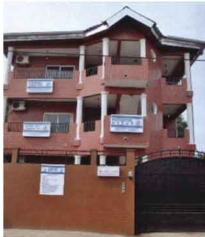
Siège social du Groupe OYONO

La création d'une entreprise repose sur des exigences et la mise en valeur d'une idée.