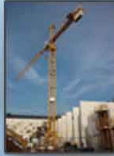
Grue & Bétonnière de chantier