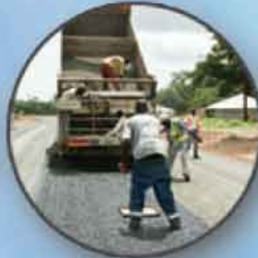
Aménagement de chaussées